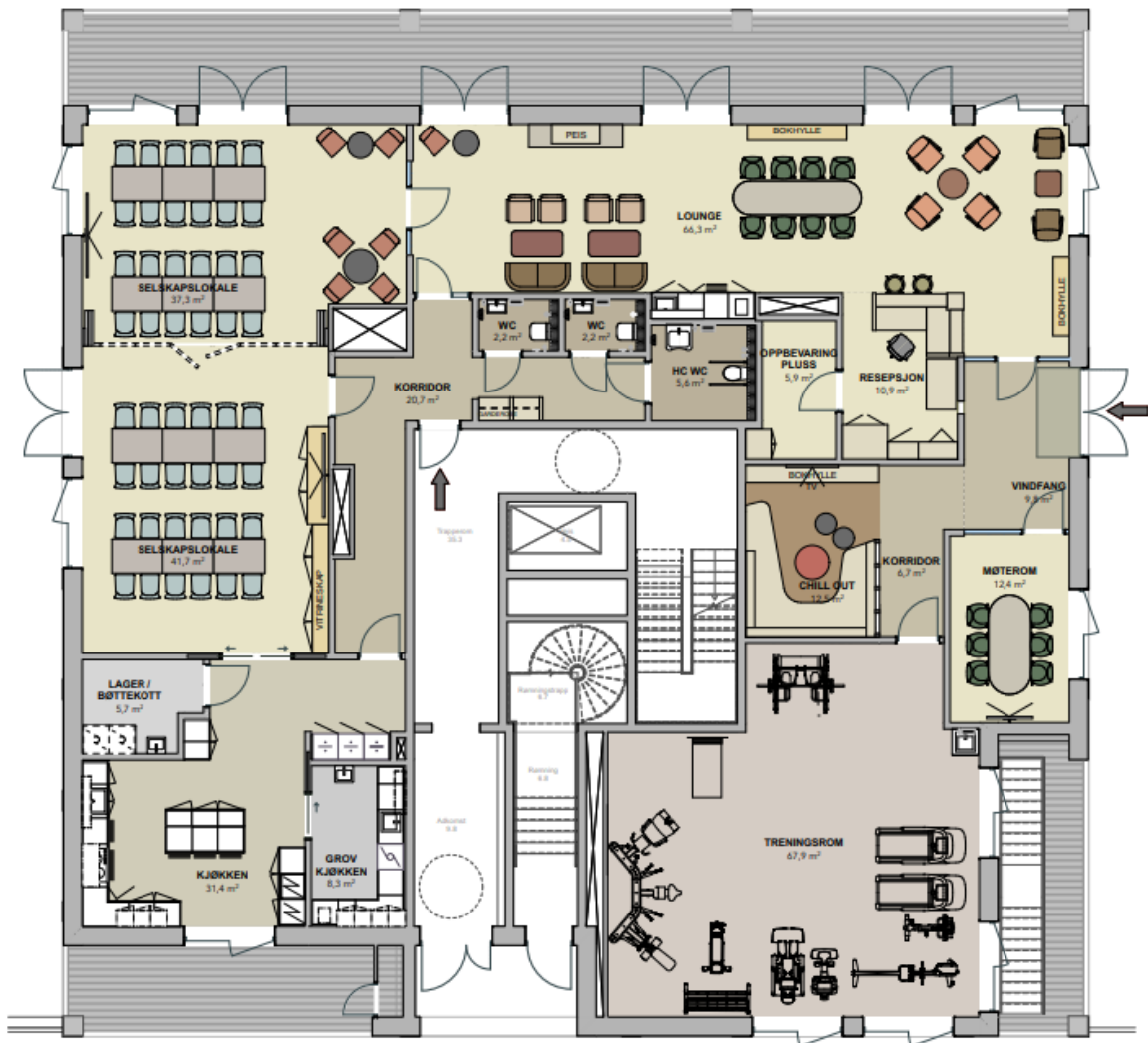
Serviceområdet ligger i 1. etasje av hus S6